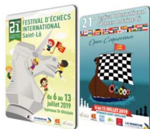
Tapis de Souris : 8€