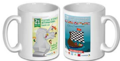
Le mug : 9€

Réservez dès maintenant vos souvenirs du Festival 2019