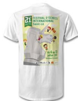
T-Shirt : 15€ Enfants 16 couleurs, adultes : blanc