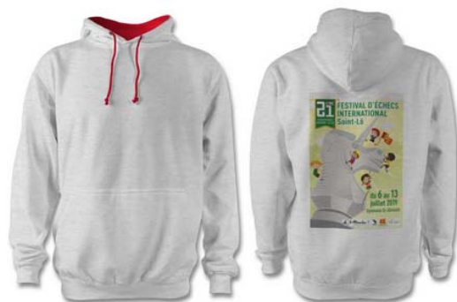
Sweat-capuche : enfant 25€ / adulte 35€ Nombreux coloris disponibles