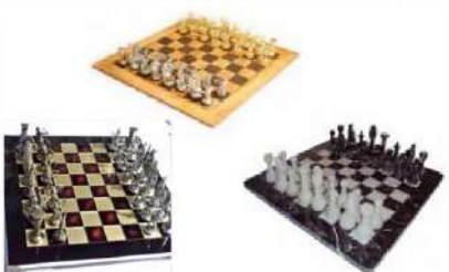
Jeux de luxe